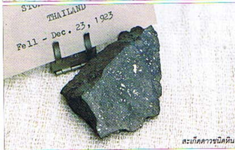
สะเก็ดดาวชนิดหิน

8-9 ปีมาแล้ว เผยแพร่ก่อนหนังสือสาร- ลิตปาร์คอีกนะครับ *