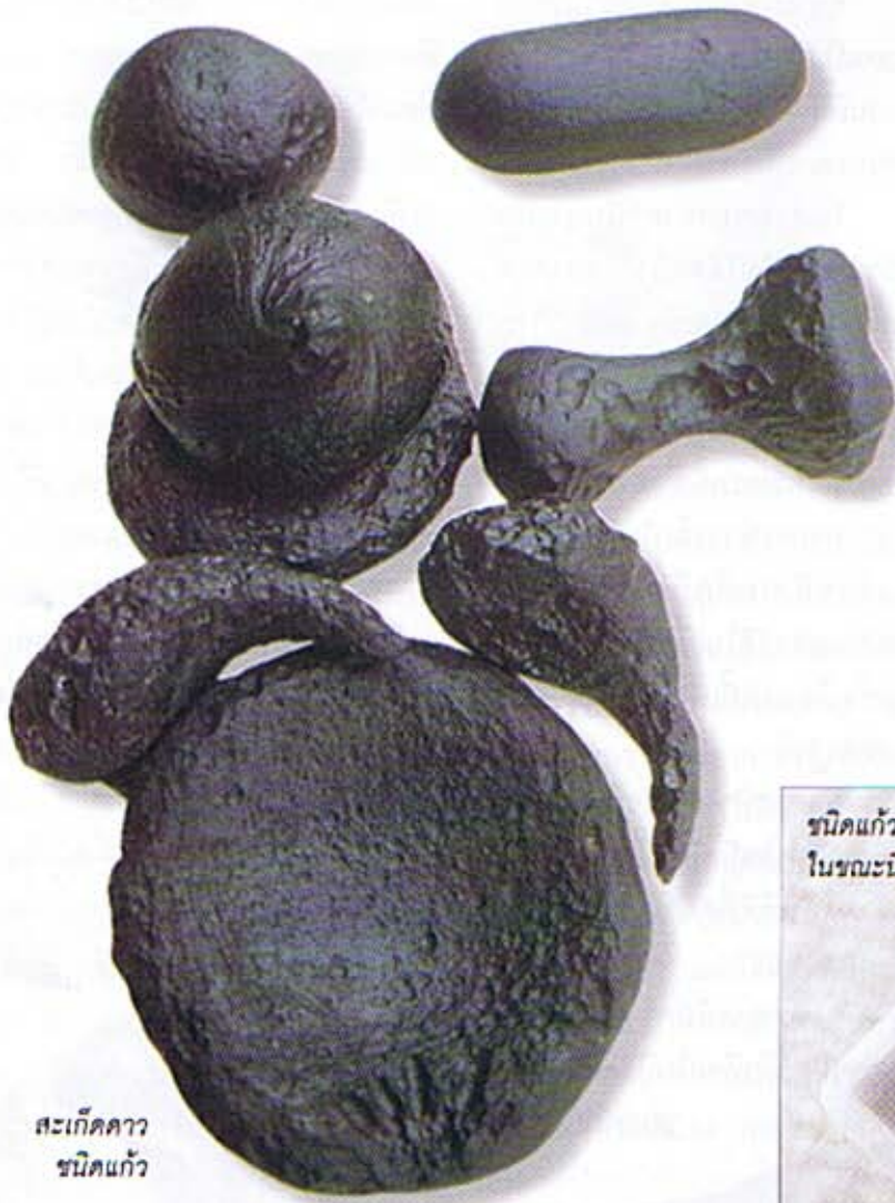
สะเก็ดดาว ชนิดแก้ว

ลูกกับแม่น้ำจะอยู่ใกล้ๆกัน ตอนนี้มี มีขนาดเล็กที่สุดคือ 0.0005 กรัม *