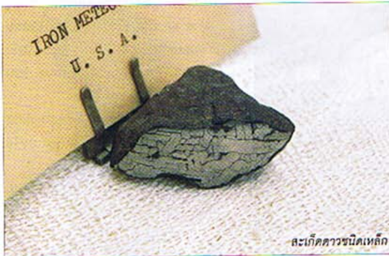
สะเก็ดดาวชนิดเหล็ก