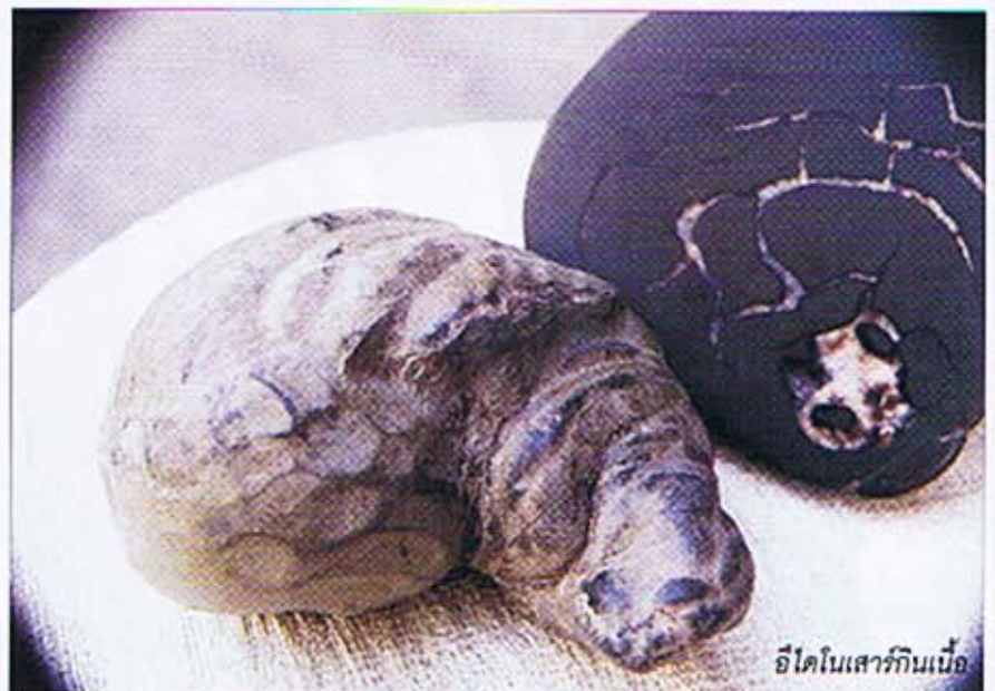
อีไดโนเสาร์กินเนื้อ